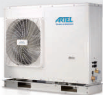
Mono 9 kW MHP9RP24