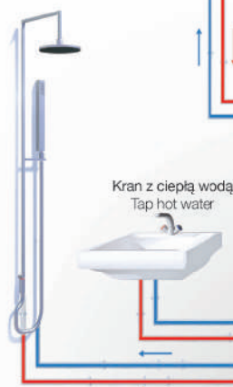
Kran z ciepłą wodą Tap hot water