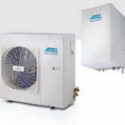
Split 8 kW SHP8RP24 out - SHPO8RP24 in - SHPI80RP24