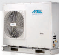
Mono 7 kW MHP7RP24