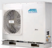
Mono 5 kW MHP5RP24