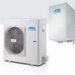
Split 6 kW SHP6RP24 out - SHPO6RP24 in - SHPI60RP24